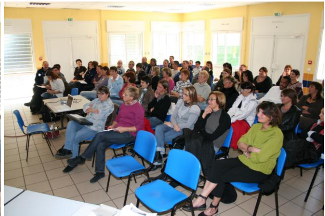
Les réunions de sensibilisation : l'intérêt et la possibilité, pour chacun, d'adopter des comportements plus respectueux de la planète a été mis en évidence par des exemples concrets

Enfin, nous avons choisi et développé, en accord avec l'équipe technique et municipale, 21 actions à mettre en oeuvre à l'horizon 2012 . Des « fiches actions » ont été réalisées pour chacune d'elles, présentant le niveau de difficulté de mise en oeuvre (M), le niveau d'avancement dans la commune (.), le bénéfice environnemental généré par l'action (♻️) et le coût d'investissement associé à l'action (€). Des pictogrammes ont été associés pour faciliter la compréhension des fiches et la hiérarchisation des actions.