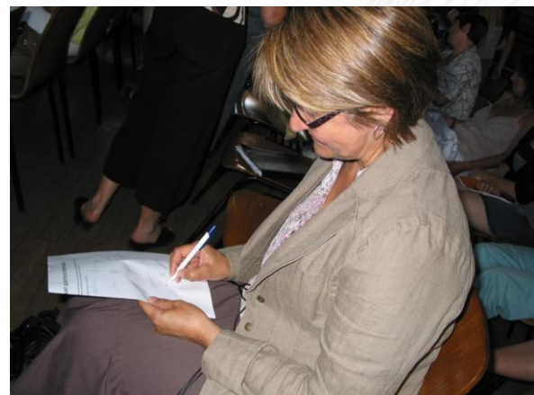
A gauche : couverture et exemples de fiches du programme d'actions « Saint-Quentin éco-responsable » A droite : Signature du programme d'action par les agents en juin 2010